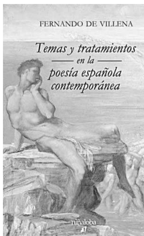
Portada del libro.

labra como expresión de las múltiples derivas, direcciones y experiencias de la singularidad humana.