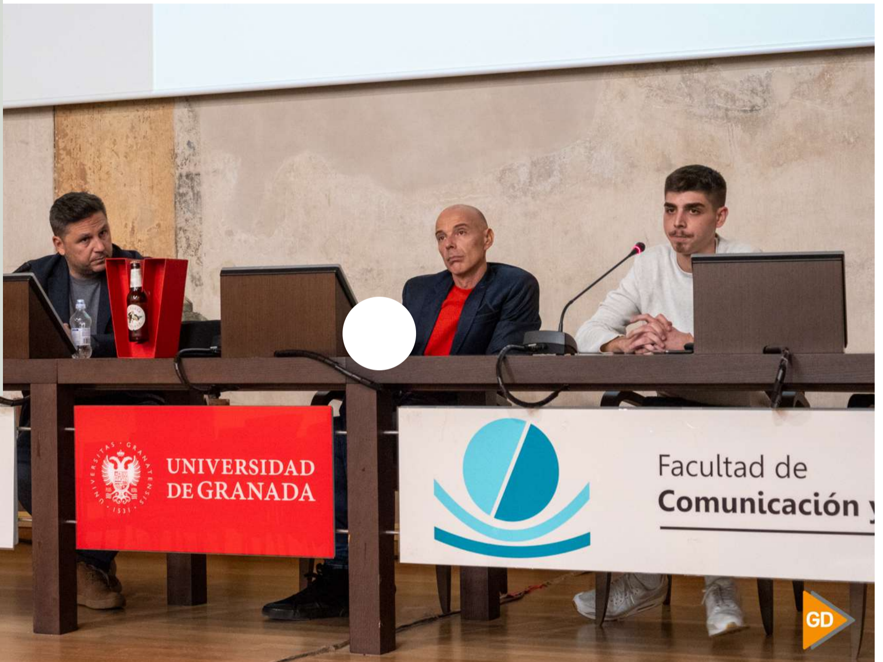
Última jornada de la muestra Granada On TV con creadores audiovisuales y comunicadores