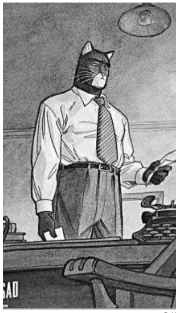
Una página del cómic.

Un éxito editorial con el que han ganado cinco Premios Eisner y un Premio Nacional de Cómic que para ellos es mucho más, es una “pasión”, según Guarnido (dibujante), una suerte de “vehículo” para que esta pareja de artistas sigan “experimentando” en otros formatos (como el hecho de que esta nueva entrega esté formada por dos tomos). “Es lo que prefiero hacer –añade el granadino afincado en Francia– puedo cambiar de aires y hacer otros tebeos, pero