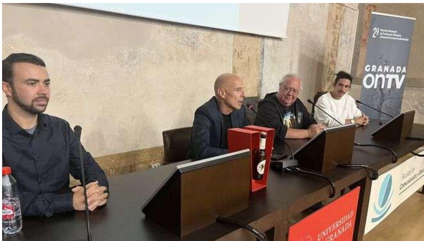
La Facultad de Comunicación acogió la inauguración del evento.