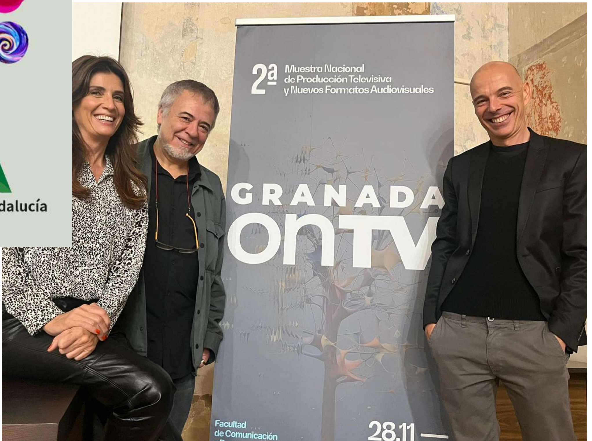
Participantes de la segunda jornada de 'Granada On TV'