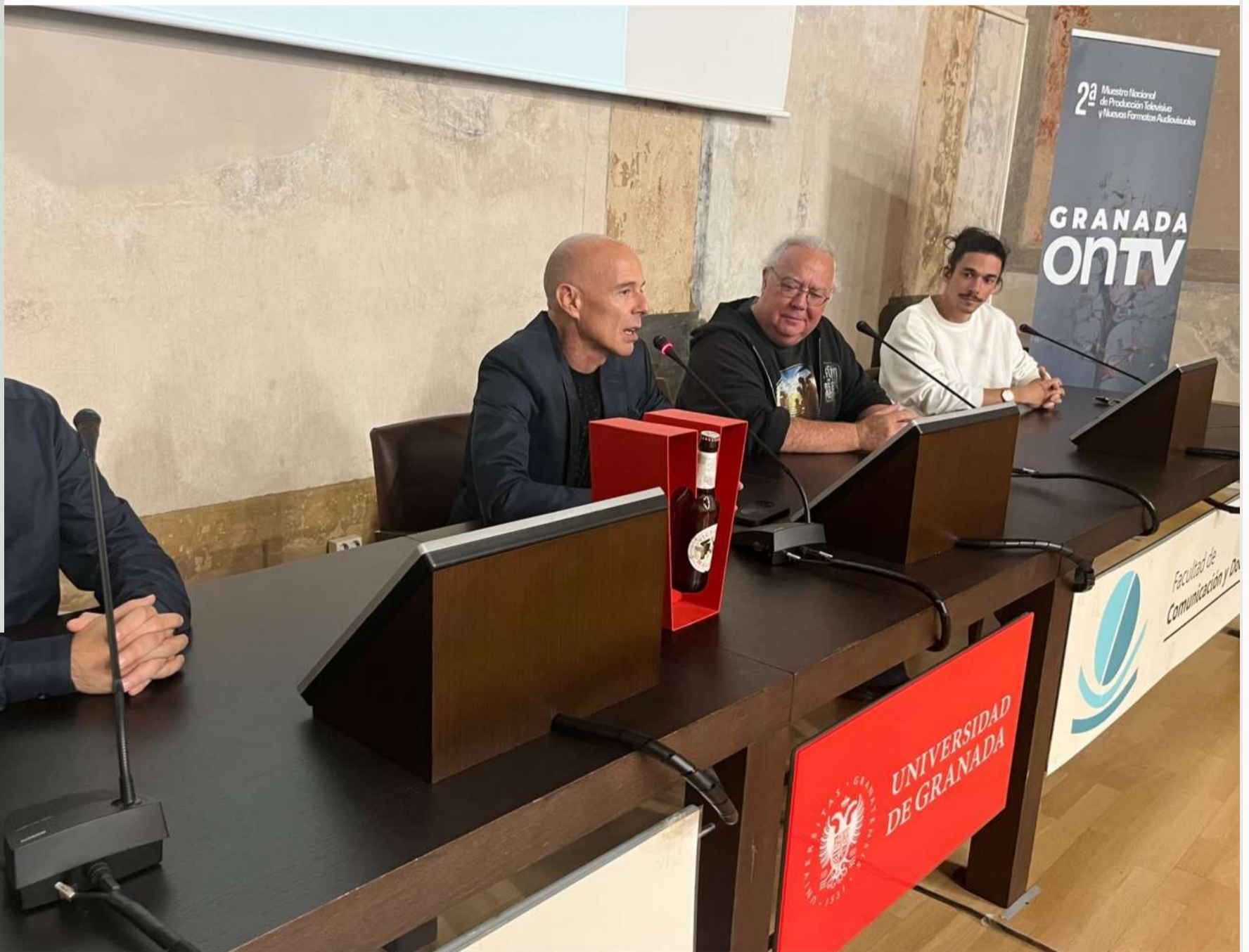
Primera jornada de Granada On TV en la Facultad de Comunicación y Documentación de la UGR