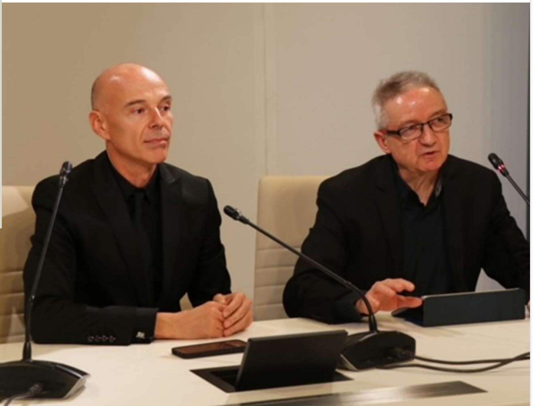
Presentación de la segunda edición de Granada On TV